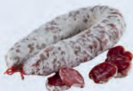
A. Du saucisson