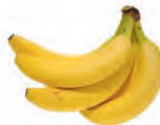
D. Les bananes