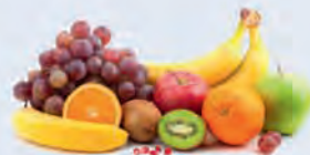
D. Des fruits