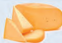
D. Du gouda