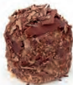
B. Un merveilleux