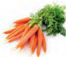
B. Les carottes