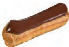
A. Un éclair