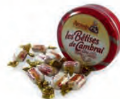
D. Des bonbons