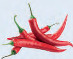
A. Le piment