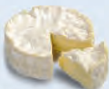
B. Du camembert