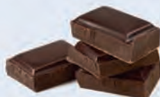
C. Du chocolat