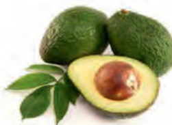
C. Les avocats