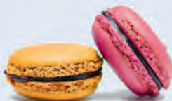
B. Des macarons