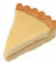
C. Une tarte au citron