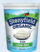
C. Un yaourt