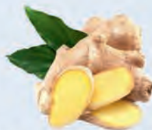
C. Le gingembre