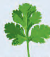
D. La coriandre