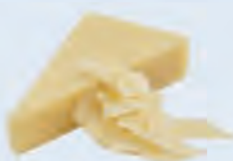
A. Du parmesan