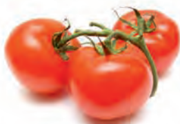
A. Les tomates